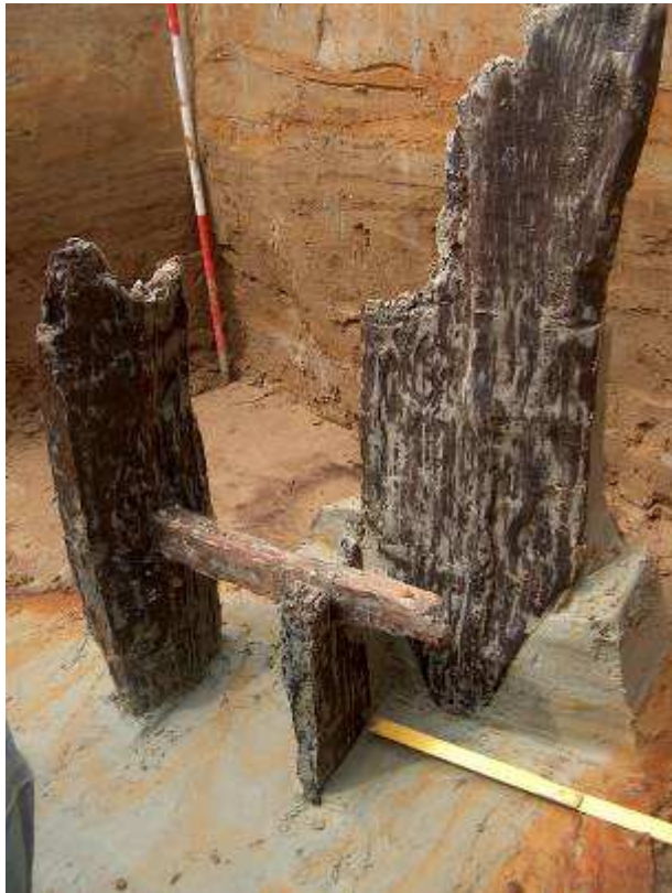
Fig. 3 Linksboven: de waterput tijdens het opgraven in het grondvlak. Rechtsboven: coupe op de waterput. Midden onder: detail van de ladder gevonden onderaan de put.

Er werd tevens een gracht aangesneden (E) die materiaal bevat van de late ijzertijd (laat La Tène)-vroeg-Romeinse periode. (voor het aardewerk werd contact gezocht met aardewerkspecialisten van Archéopole, een archeologisch bedrijf dat actief is in N-Fr.). Ten noorden van deze gracht werden slechts een 2-tal sporen aangesneden: een haardje en een kuil, mogelijk de enige restanten van een gebouw. In de gracht zit veel aardewerk, wat bewoning in de directe omgeving doet vermoeden. Deze gracht wordt systematisch uitgegraven in het kader van talrijke klasbezoeken. De gracht wordt onderbroken aan beide uiteinden. In het westen lijkt hij een aantal meter voor de grote gracht (zie verder, F) te stoppen, om vervolgens aansluitend op deze laatste, naar het westen verder te lopen. Kan deze onderbreking ten oosten van de grote gracht een indicatie zijn voor een bestaande wal? We zullen nog een coupe moeten maken ten oosten van de grote gracht om eventueel een “begraven bodem” aan te treffen.