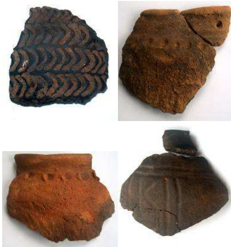
Fig. 2 Een greep uit het aardewerkensemble.

Er werd een hoek van een ijzertijderf aangesneden, omgeven door een dubbele gracht (A). Daarbinnen ligt een hoofdgebouw (B) met parallel hieraan een afwateringsgreppel (C). Het aardewerk uit het gebouw bevat materiaal uit de late ijzertijd (zowel vroege als late La Tène). De sporen bevatten veel verbrande leem, verbrand bot, er werden ook enkele aanwijzingen voor metaalbewerking aangetroffen. Vermoedelijk weerspiegelt het vondstenensemble de opgave-fase.