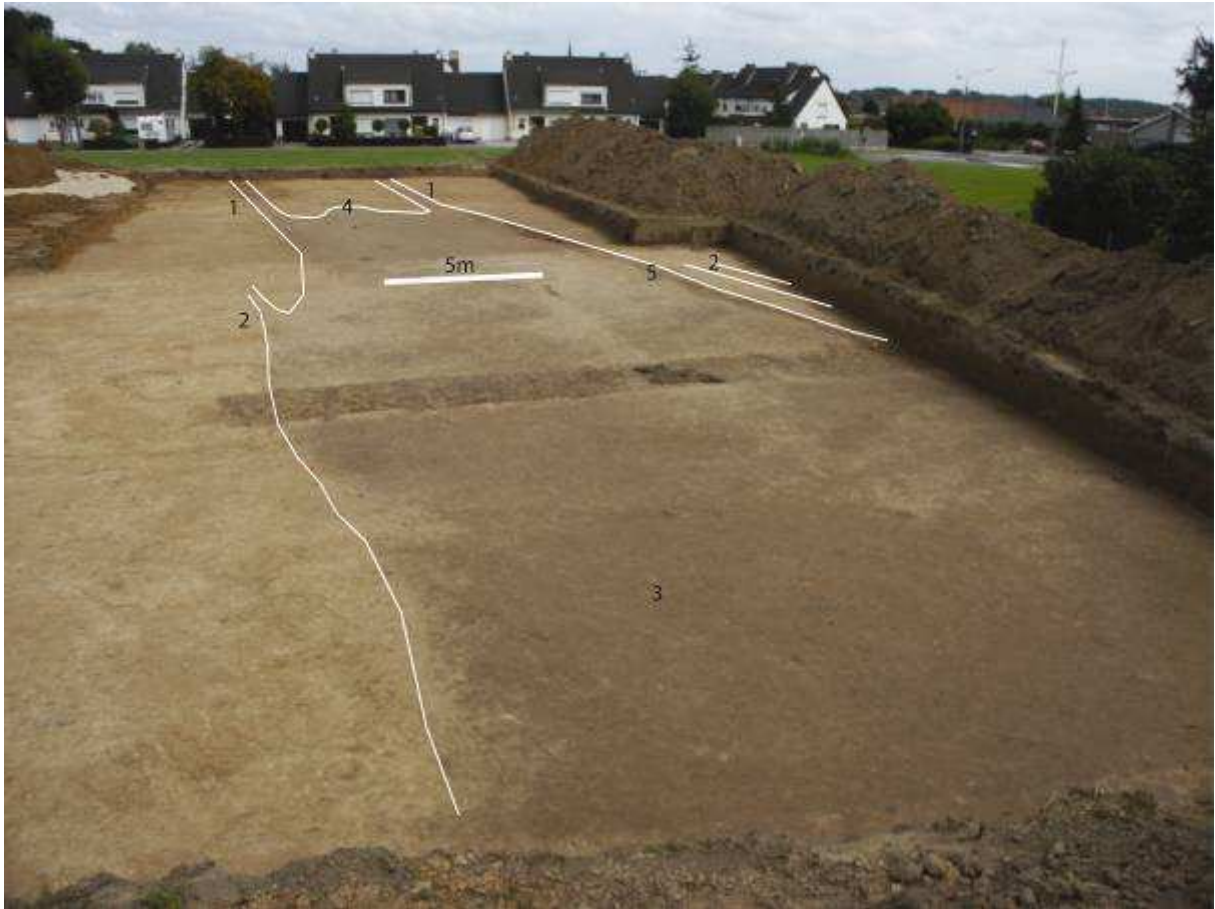
Fig. 6 Wegtracé in werkput 4: 1. Diepste afwateringsgreppels 2. Minder diepe afwateringsgreppels 3. Wegdek 4. Karrensporen 5. Kleiige band

Omdat in het proefsleuvenonderzoek niet duidelijk was wat er in deze zone aan de hand was, hebben we hier een nieuw vlak aangelegd. Onze verbazing was groot toen ook hier een wegtracé werd aangesneden (!). Het tracé wordt geleidelijk aan minder diep (naar het oosten toe haast volledig opgenomen in ploeglaag)! In het oosten zijn nog enkel 2 afwateringsgreppels bewaard. Op de overgang waar het wegtracé wordt opgenomen in de ploeglaag, vinden we karrensporen terug. Is dit een aftakking van de weg? Of maakt de weg hier een knik? Zoja, waarom? Lag hier reeds iets? Deze zone moet ook worden afgegraven.